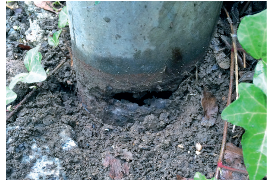
Korrodiertes Leuchtenmast im Bodenbereich

Die Netze BW setzt bei der Prüfung Ihrer Straßenbeleuchtungsmasten auf akkreditierte Prüfverfahren.